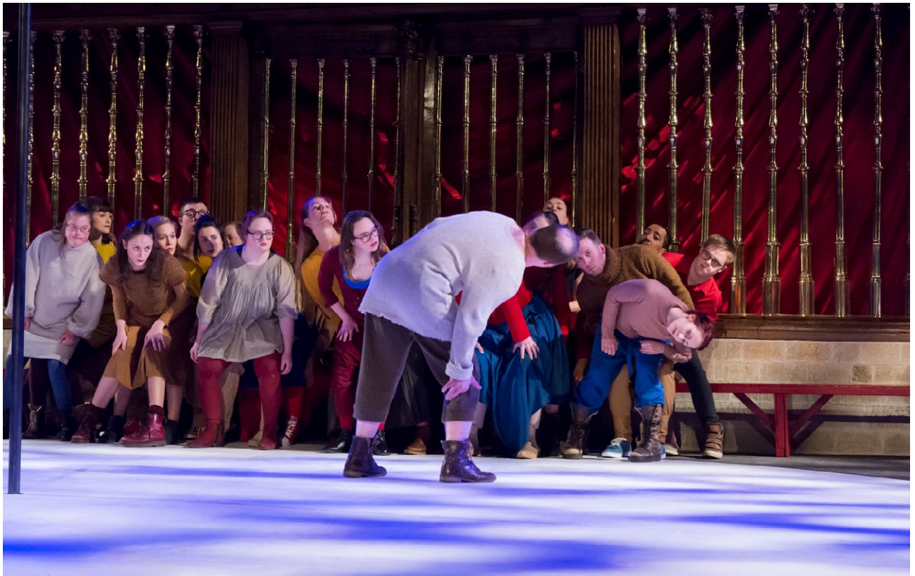
Het Oog van Godot i.s.m. Tiuri